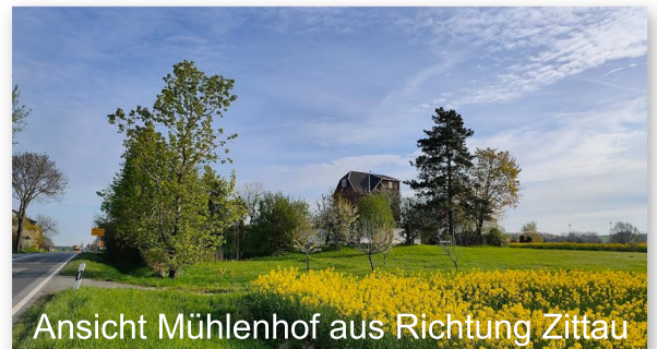
Ansicht Mühlenhof aus Richtung Zittau

Fahren Sie auf der B178 bis Ausfahrt Oberseifersdorf. Biegen Sie nach links auf die Löbauer Straße (S132) ab und fahren ca. 1,2 km in Richtung Löbau. Auf einer kleinen Anhöhe biegen Sie ca. 50 m nach dem Ortseingangsschild „Oberseifersdorf“ nach rechts auf den Mühlenhof ein.