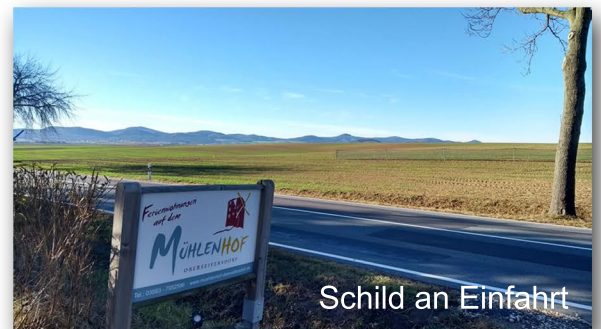
Schild an Einfahrt

Fahren Sie aus Zittau nach Norden in Richtung Löbau (S132). Sie passieren Eckartsberg und fahren aus der Ortschaft heraus. Nach der Überquerung der B178 fahren Sie ca. 1,2 km weiter bergauf bergauf bis Sie das Ortseingangsschild „Oberseifersdorf“ erreichen. Nun biegen Sie nach ca. 50 m rechts auf den Mühlenhof ein.