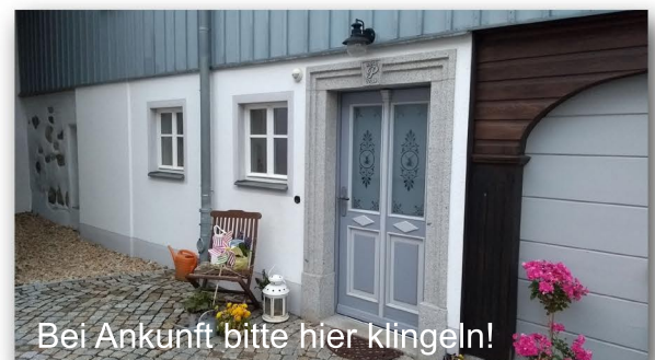
Bei Ankunft bitte hier klingeln!

Von den Bahnhöfen Löbau und Zittau aus fährt tagsüber stündlich die Buslinie 10 ab. Diese hält an der Bushaltestelle „Oberseifersdorf - Feldschenke“. Von der Bushaltestelle aus sieht man in ca. 150 m Entfernung bereits den Mühlenhof, zu dem ein Fußweg an der Straße hinführt.